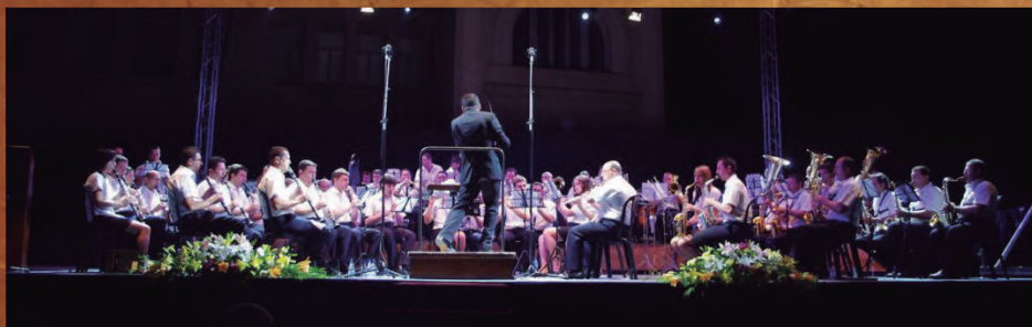
Concert de Festes, 17 d'agost de 2011.

I per demanar, els serveis portàtils que cal millorar-los. No estaria malament portar uns portàtils de més qualitat.