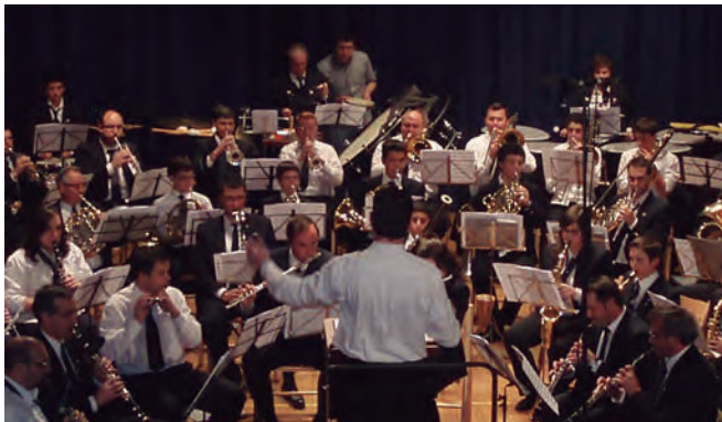
Societat Musical de Banyeres de Mariola, 22 de gener de 2011