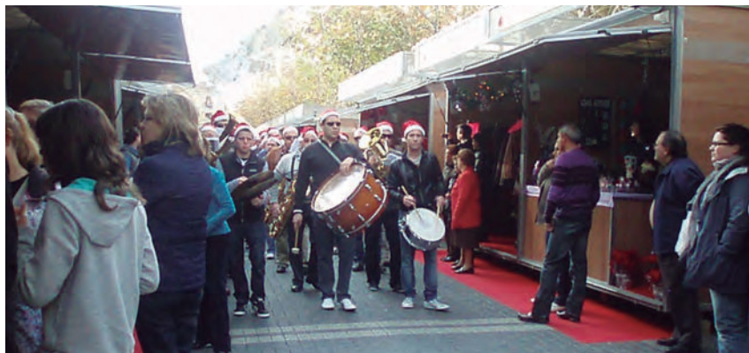
II Fira de Nadal 13 de desembre de 2010

L'Agrupació ArtísticoMusical "El Trabajo" de Xixona va participar en aquesta fira, oferint al públic cercaviles a càrrec de la pròpia banda i de la Banda Jove de la nostra Agrupació, actuacions de grups formats per membres de la banda, petits tallers de música per als xiquets, audicions multimèdia de concerts i actuacions... A més, es van poder adquirir els treballs que hem enregistrat, el llibre de la Història de la Banda de Xixona, felicitacions nadalengues, etc. I per als xiquets vàrem regalar flautes dolces.