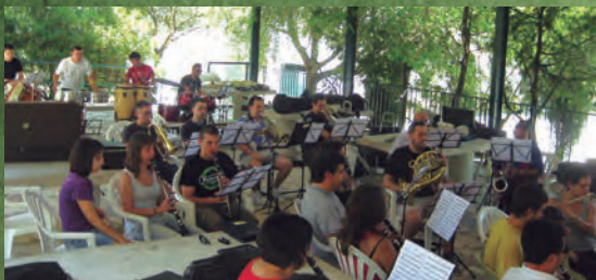
Finca Cano, fent l'assaig abans de dinar.