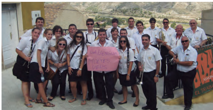
Participant en el Lip Dub, 18 d'agost de 2011.

L'Agrupació Artisticomusical "El Trabajo" de Xixona va participar en l'enregistrament del Lip Dub que va organitzar el grup de música de rock xixonenc Mugroman. No podíem faltar a aquesta cita amb el nostre tros de cançó: Una llengua moltes veus / una història el nostre dret / una dia per a mi la gent.