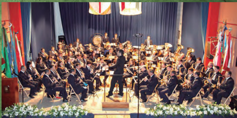
Concert Mig Any, 25 de febrer de 2011.

Cosa curiosa és que la banda estava gravant el concert, sobretot amb la intenció de tindre una gravació de Fiesta en Jijona amb bona sonoritat, a petició de la Federació i d'acord amb ells. Al segon fort de l'himne de festes, el poble de Xixona no va poder contenir l'emoció i tot el Cine va esclatar en aplaudiments.