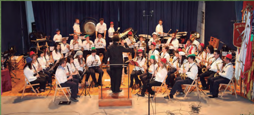
Concert Mig Any Banda Juvenil de Xixona, 22 de febrer de 2011.