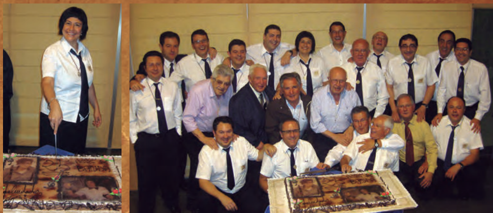
Concert de Primavera, els Medalleros de la Banda. 20 de maig de 2011