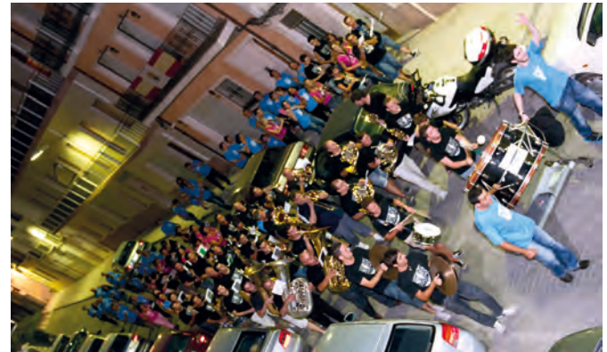
Cap a la Industrial, Soparet Capitania Cristiana.

El tercer soparet de festes la Banda participava plenament en la filà Cavallers del Cid. Jony i Lucas celebraven el sopar de Capitans, i volien fer-ho d'una manera esplendorosa. La banda és un atractiu però, la baixa participació de fester d'aquesta filà van fer que dubtarem en sí tocaríem o no.