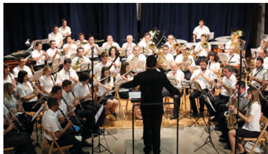
Música, dia de Medallers, bon temps, què volem més?

La solució va ser posar en el Concert de Primavera, així, matàvem el cuquet quan el dia s'allarga, la temperatura és la idea i aprofitem per donar als companys que enguany compleixen 25 anys com a músics.