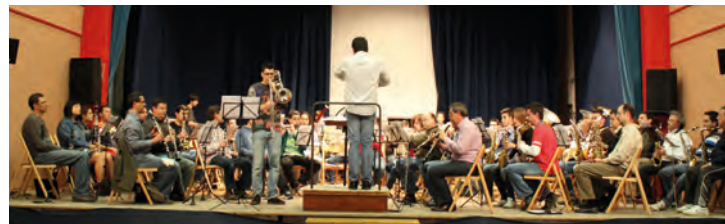
Assaig general enregistrament CD, divendres 4 de maig de 2012.