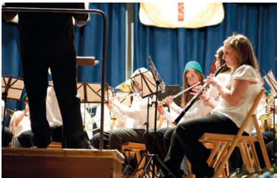
Concert Banda Jove de Xixona, 22-II-12.

En l'entremig es donaren els premis del concurs de Caps d'Esquadra i els diplomes de la llicenciatura de l'Escola de Festes.