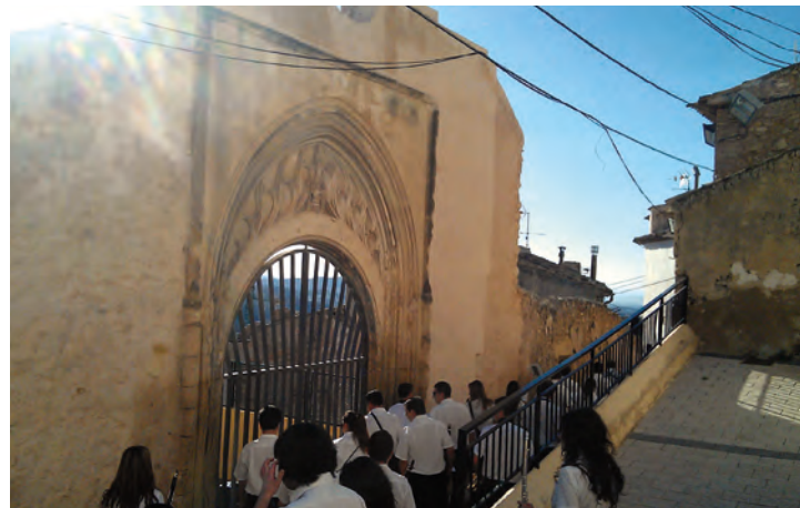
En l'església vella en la cercavila del 9 d'octubre.