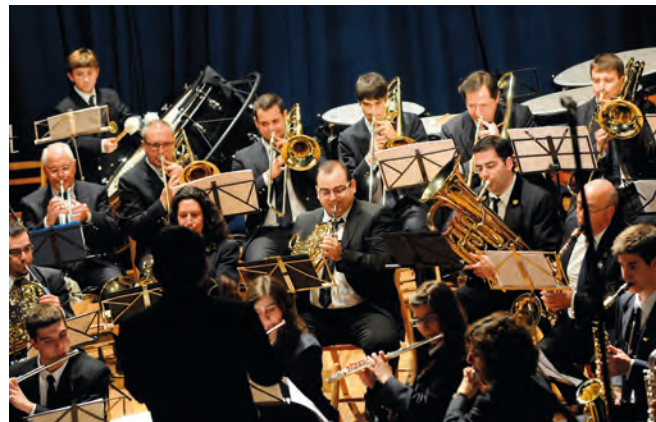
Concert del Mig Any, 24 de febrer de 2012.

Com en el concert de la Banda Juvenil, en l'entremig, s'aprofitaren per donar els premis de fotos, de cartell anunciador i premis dels tornejos de festes del 2011.